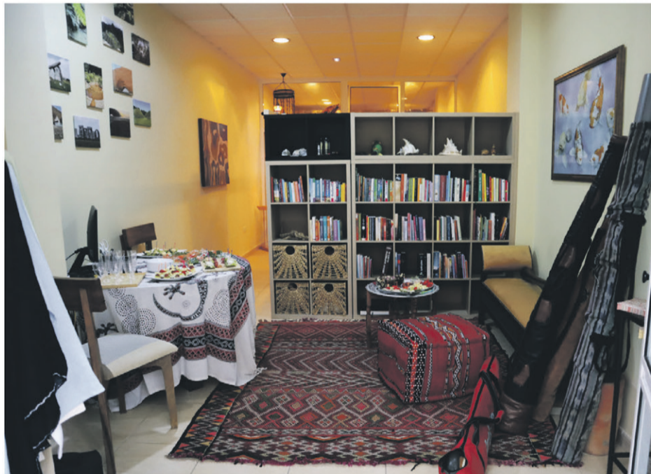
Die Kristallmatte harmonisiert Körper und Geist

Das Zentrum ist in der Avenida Familia Bethencourt y Molina 27, Edificio Bahamas Bajo, Local 6 in Puerto de la Cruz. Geöffnet ist an Werktagen von 10 bis 16 Uhr und nach Vereinbarung über die Telefonnummer 621 421 300.